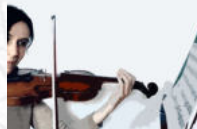
CÁROL CD Violín (02, 09)